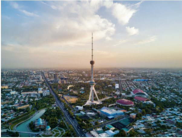
塔什幹插圖：新設立的塔什幹辦事處為吉布達偉士的絲綢之路戰略增添新版圖。