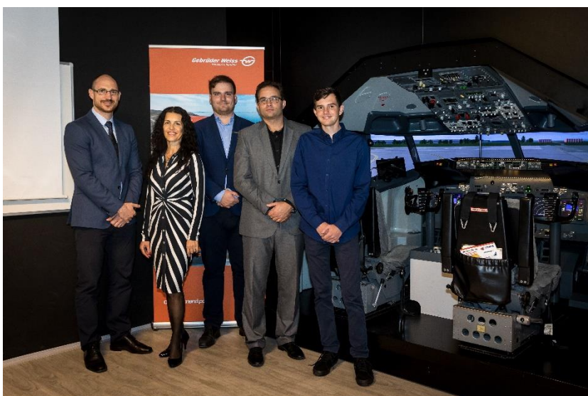
Zástupci firmy Gebrüder Weiss a Střední průmyslové školy dopravní v Praze